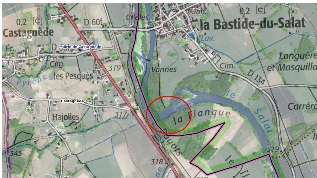
Figure 1- Localisation du secteur sur le Salat envisagé pour le contrat

Le linéaire concerné est d'environ 200 m de long et 10 m de large et entre bien dans le périmètre ajusté en novembre 2024.